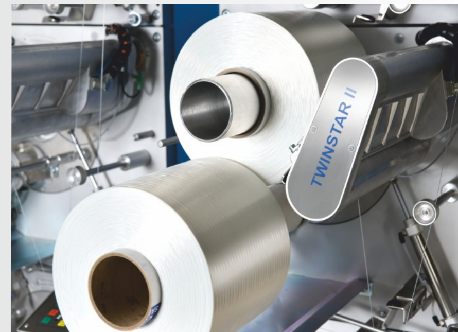
Automatischer Take-up Spuler für technische Garne bis 2500 m/min.