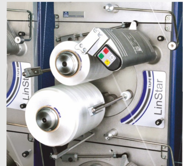
Automatischer Take-up Spuler für Bändchen mit variabler Fadenverlegung