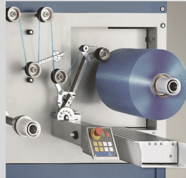
Parallel-Spuler mit Spindelchangierung für Klebebänder und Prepregbändchen