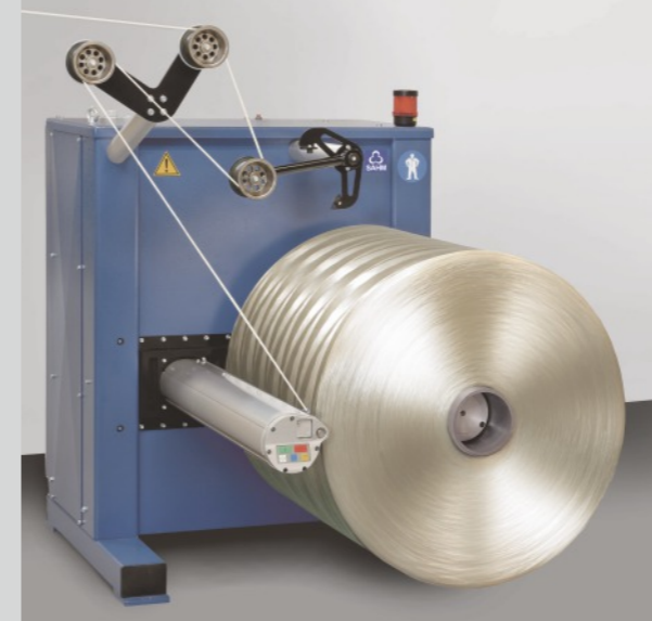
500 kg Jumbospuler für PAN Precursor Garne